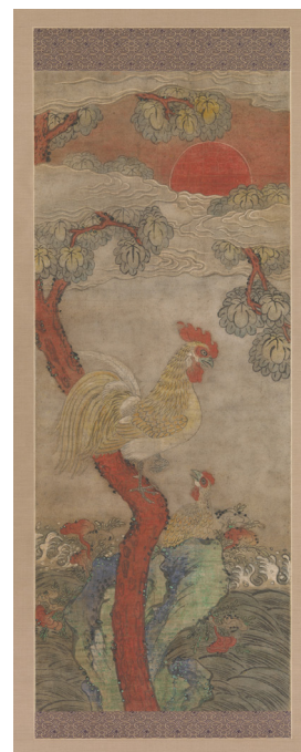
Golden Rooster and Hen [afb. 1] rolschildering, inkt en kleuren op papier, Korea, 19de eeuw, 114,3 x 45,67 cm., Metropolitan Museum, New York, inv. nr. 19.103.2

Van de Koreaansche schilderijen, is het meest exceptioneele stuk een in felle kleuren gehouden compositie van een haan en een kip [afb. 1]. Zeer zeker een uiting van Oost-Aziatischen kunstzin, maar noch Chineesch, noch Japansch. Belangrijk van compositie, en soms zeer gelukkig van lijn, is een, eveneens Koreaansche, tempelschildering met een voorstelling van zes Bodhisattwa's;