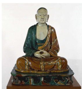
Lohan [afb. 8], China, Liao-dynastie (907-1125), steengoed, hoogte 103 cm., British Museum, Londen, inv.nr. 1913,1221.1