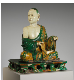
Lohan [afb. 7], China, Liao-dynastie (907-1125), steengoed, hoogte (met sokkel) 233,7 cm., Metropolitan Museum, New York, inv.nr. 20.114

[afb. 5], waarschijnlijk Avalokiteshvara, China, vroeg 6de eeuw, steen, hoogte 54,1 cm., Metropolitan Museum, New York, inv.nr. 18.56.40