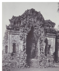
Candi Kalasan bij Yogyakarta [afb. 5], ca. 1895 - 1915, ontwikkelgelatine-zilverdruk, 15,2 x 10,6 cm (foto), 24,3 x 32,9 cm (blad), Rijksmuseum, inv. nr. RP-F-00-5346-104