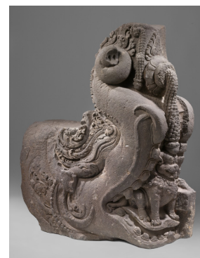
Makara van de hoofdtempel van Candi Sewu in de Prambanan-regio op Midden-Java

*) Vooral zij gewezen op een der makara's [afb. 14] 16 die een ingang van den hoofdtempel siert (photo No. 4423 van den O. D. [afb. 15]) 17 Hier is wel het hoogste in de uitvoering van Hindoe-Javaansch ornament-beeldhouwwerk bereikt.