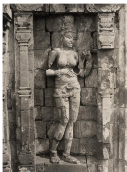
Detail van Candi Sari bij Yogyakarta [afb. 11], 1926, Universiteitsbibliotheek Leiden, inv. nr. OD-8399