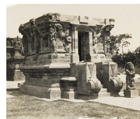
Nagatempel van het complex Panataran nabij Blitar [afb. 13], na de restauratie, ca. 1920, Universiteitsbibliotheek Leiden, inv. nr. KITLV 33500

Dat de belangen der Hindoe-Javaansche bouwkunst - een der heerlijkste uitingen van architectuur die we kennen -, zoo goed mogelijk, en met diep aesthetisch en archaeologisch inzicht worden behartigd, is en blijft voorloopig de eerbiedige plicht van ons Nederlanders. Wat hier op het spel staat, is van dien aard, dat persoonlijke belangen moeten wijken voor de zeer goede en immens importante zaak.