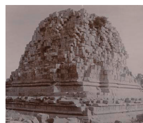
Candi Sojiwan bij Yogyakarta [afb. 9], ca. 1901 - 1911, 18 x 24 cm (origineel negatief), Universiteitsbibliotheek Leiden, inv. nr. OD-00362