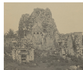
Candi Sewu, tussen 1863 en 1956 [afb. 15], Universiteitsbibliotheek Leiden, inv. nr. OD-4423, nog niet via de website UBL toegankelijk.

[afb. 14], afkomstig van de rechterkant van de oostelijke ingang, ca. 800-900, vulkanisch gesteente (andesiet), 97 x 99 x 37 cm, Rijksmuseum, Amsterdam, bruikleen KVVAK, inv. nr. AK-MAK-247