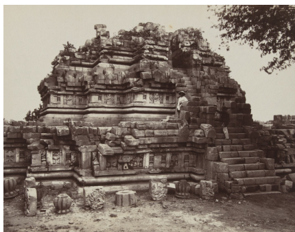
Kassian Céphas, Brahmatempel van het Lara Jonggrang / Prambanan tempelcomplex bij Yogyakarta [afb. 10], 1889-1890, albuminedruk, 16,5 x 22,2 cm, Rijksmuseum, inv. nr. RP-F-F18049

De eigenaardige en sublieme samenstelling (en verwerking N.B.) van oorspronkelijk Voor-Indische bouw- en sierelementen op Java, die tot de zoo bijzonder karakteristieke, wel overwogen, qua kunst klassieke, Hindoe-Javaansche architectuur heeft geleid, kan, als combinatie, in geen enkele gespaard gebleven uiting van Voor-Indische bouwkunst aangewezen worden . Vandaar bestaat er een hoogst interessant, bij uitstek boeiend, doch schier onmogelijk op te lossen, probleem omtrent den oorsprong der Hindoe-Javaansche kunst.