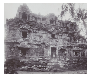
Candi Sari bij Yogyakarta [afb. 3], ca. 1895 - 1915, ontwikkelgelatine-zilverdruk, 11,4 x 15,4 cm (foto), 24,3 x 32,9 cm (blad), Rijksmuseum, inv. nr. RP-F-00-5346-103