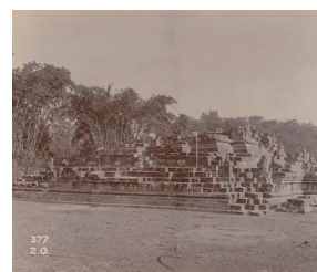
Candi Bubrah bij Yogyakarta [afb. 7], ca. 1901 - 1911, 18 x 24 cm (origineel negatief)