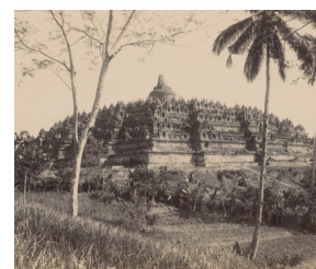
Onnes Kurkdjian, Gezicht op de Borobudur op Java [afb. 2], 1912, daglichtgelatine-zilverdruk, 17,5 x 23,4 cm, Rijksmuseum, inv. nr. RP-F-F01069-J