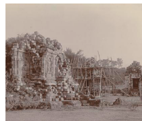
Tempelsterrein Candi Lumbung bij Yogyakarta [afb. 8], ca. 1901 - 1911, 18 x 24 cm (origineel negatief)