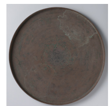
Talam [afb. 14], bronzen offerblad, ooit onderdeel van de collectie van de familie Resink uit Yogyakarta, Indonesië, Oost-Javaans, 930-1600, brons, diameter 48 cm, hoogte 2 cm, Rijksmuseum, Amsterdam, inv. nr. AK-MAK-316