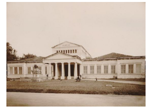
Museum van het Bataviaasch Genootschap voor Kunsten en Wetenschappen in Weltevreden te Batavia [afb. 7], ca. 1925, Universiteitsbibliotheek Leiden, inv.nr. KITLV 116901

Te prijzen is de opstelling in de goud- en zilver-kamer in het Bataviaasch Museum. Er is hier zeer veel schoons te vinden. Behalve op Hindoe-Javaansch gebied, ook van de edelsmeedkunst der buitenbezittingen. Buitengemeen zijn de sublieme Hindoe-Javaansche gouden oorsieraden, die binnen een paar kubieke centimeters die heele goddelijke, tintelende schoonheid der Hindoe-Javaansche ornamentiek en plastiek openbaren.