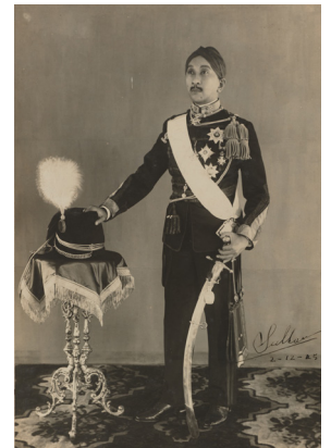
Staatsieportret van Hamengkoe Boewono VIII / Hamengkoe Boewono VIII (1880-1939) [afb. 4], sultan van Yogyakarta (1921-1939), Nederlands-Indië, 2 december 1925, 37 x 27 cm, Rijksmuseum, Amsterdam, inv.nr. NG-2008-13-1