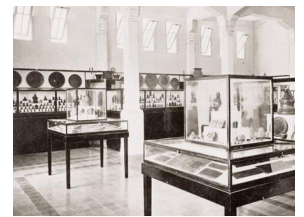
Bronskamer in het Museum van het Koninklijk Bataviaasch Genootschap voor Kunsten en Wetenschappen te Batavia [afb. 8], ca. 1930, prentbriefkaart, Universiteitsbibliotheek Leiden, inv.nr. KITLV 38529