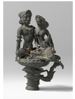
Bronzen sculptuur van een zittende man en vrouw [afb. 13], ooit onderdeel van de collectie van de familie Resink uit Yogyakarta, Java, Oost-Javaans, 900-1200, brons, 7,3 x 4,7 x 3,4 cm (inclusief sokkel 12,1 cm hoog), Rijksmuseum, Amsterdam, inv.nr. AK-MAK-253