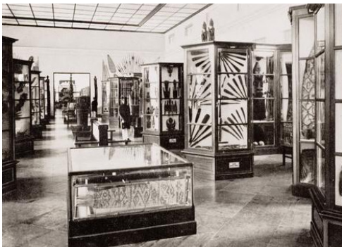
Etnografische zaal in het Museum van het Koninklijk Bataviaasch Genootschap voor Kunsten en Wetenschappen te Batavia [afb. 10], ca. 1930, prentbriefkaart, Universiteitsbibliotheek Leiden, inv.nr. KITLV 38528