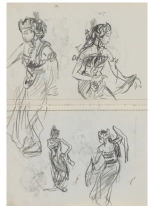
Marius Bauer, Vier dansende serimpies [afb. 3], Indonesië, 1925, potlood, 21,7 x 14,5 cm (schetsboekblad), Rijksmuseum, Amsterdam, inv.nr. RP-T-1949-680-18