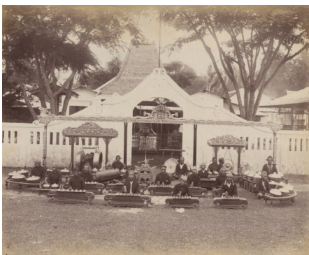
Voorbeeld van een gamelanorkest [afb. 6], 1894, albuminedruk, 22,5 x 28 cm, Rijksmuseum, Amsterdam, inv.nr. RP-F-F01153-0

Verder heb ik te Djocja nog een avondreceptie bij den Pakoe Alam [afb. 5] 16 mee mogen maken. Sommigen verzekerden, dat de Pakoe Alam over het schoonste gamelang-orkest [afb. 6] 17 beschikt, dat op Java te vinden is. En gaarne neem ik dit aan, want deze gamelang is bij uitstek nobel en gaaf.*