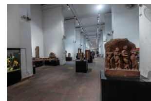
Indian Museum [afb. 2], Kolkata