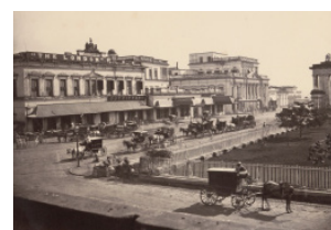
Samuel Bourne (toegeschreven aan), Straatgezicht te Kolkata (Calcutta) [afb. 1], 1863 - 1867, foto, 22,8 x 29 cm, Rijksmuseum, Amsterdam, inv. nr. RP-F-F80451

Voor hen, die in Indië de beeldende kunst komen bestudeeren, moeten in Calcutta de archaeologische afdeling en de kunst-sectie van het omvangrijke Indian Museum nummer één op het programma staan [afb. 2].