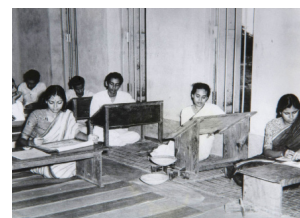
Schilderles in Santiniketan