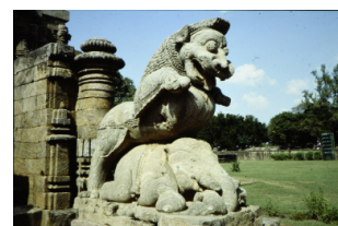
Detail Konark tempel: het hindoeïsme overwint het boeddhisme (de leeuw overwint de olifant) [afb. 8], foto door F.M. Cowan en Henk van Rinsum, 1982, Wereldmuseum, Amsterdam, inv.nr. TM-20084370