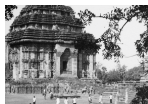
Konark tempel [afb. 7], foto van Henk van Rinsum, 1982, Wereldmuseum, Amsterdam, inv.nr. TM-20005143