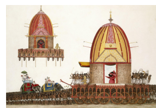
Jagannath-wagen. De god Juggernaut op zijn wagen tijdens de Rath Jatra [afb. 6], Puri, ca. 1820-1822, schildering, 46,5 x 67,5cm, Vitoria & Albert Museum, Londen, inv.nr. IM.193-1920