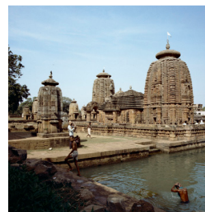
De Mukteswar tempel in Bhubaneswar in de staat Orissa [afb. 9], foto door N.C.R. Bogaart en F.M. Cowan, 1977, Wereldmuseum Amsterdam, inv.nr. TM-20042948

Door Muktesvara in een gelukzalige stemming gekomen, aanvaardde ik de terugreis naar Calcutta, dat ik spoedig na aankomst weer verliet, om het door de schuld van den onbetrouwbaren Purischen ossenkardrijver een dag