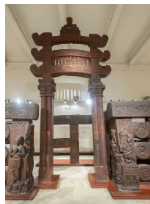
Indian Museum, Kolkata, Bharhut stoepa, de oostelijke poort [afb. 3]

Het zij mij veroorloofd hier enkele zinnen uit mijn vorigen, over Siam handelenden, brief aan te halen. Ik zei daarin: "De Siameesche kunst als geheel, deelt, naar mijn gevoel, het lot van de Khmer-kunst. Zij behoort in Azië tot een aesthetisch nevengebied. De prachtig sonore de stralend-emotioneele kernkunst concentreerde zich in dit deel van Azië, Zuidwaarts, op onzen Archipel; vond, Noordwaarts, haar weg naar Nepal en Tibet."